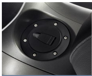
PRAKTISCH, TANKVERSCHLUSS AUF DEM MITTELTUNNEL