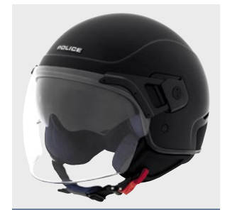
STILECHT ALS ZUBEHÖR - DER POLICE-HELM