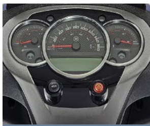
COCKPIT MIT KLASSISCHEN RUNDINSTRUMENTEN UND LCD-DISPLAY