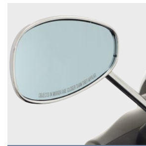
VERCHROMTE SPIEGEL MIT BLAUGETÖNTEM GLAS

Stylish, wie die Sonnenbrillen der italienischen Kultmarke Police, zieht der Beverly Police die Blicke auf sich. Cool & smart, präsentiert sich der Police in edlem, überwiegend mattem Schwarz. Das Großstadttrevier ist seine Szene. Er genießt die Blicke, die ihn bei jedem Halt fixieren. Während du dich darüber freust, fast immer in der ersten Reihe zu stehen. Du freust dich darauf, wenn gleich die Ampel auf Grün umspringt und dein Beverly kraftvoll durchstartet. Vor allem freust du dich darüber, dass Rushhour und Parkplatzsuche in der City für dich ein ganz neues Gesicht bekommen. Ob es ein Beverly Police 300 oder ein Beverly Police 350, ob es 21 oder 30 PS sein sollen, das bleibt am Ende deine Entscheidung. Jede Menge Fahrspaß bieten beide.