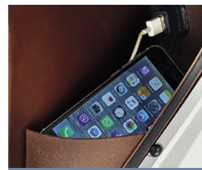
USB-ANSCHLUSS IM HANDSCHUHFACH